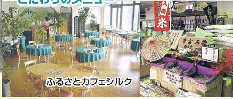
ふるさとカフェシルク