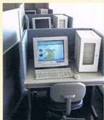
インターネット体験パソコン