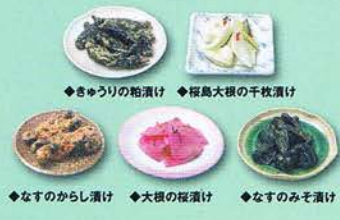
◆きゃうりの粕漬 ◆桜島大根の千枚漬 ◆なすのからし漬 ◆大根の板漬 ◆なすのみそ漬

素朴な田舎の本物の味。土づくりからはじめたこだわりの野菜を使用。自然の持ち味を生かした本物の味をぜひ、ご賞味ください。