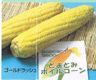
とよとみポイルコーン 地元産スイートコーン使用