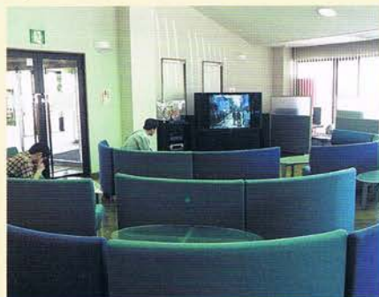
ふるさとネット(情報発信室・休憩所)