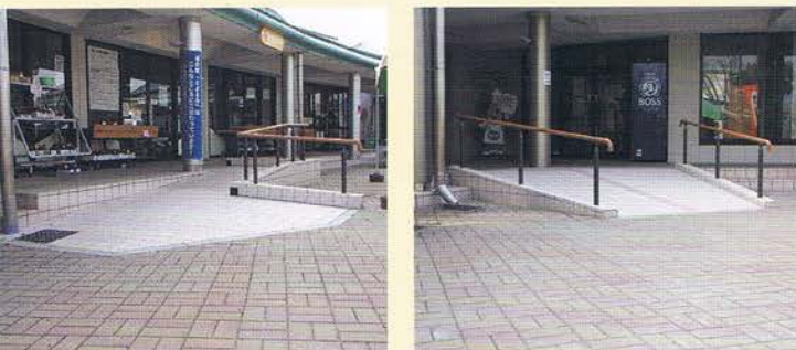
車イスでも安心です